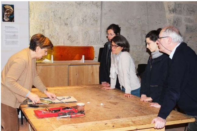
Visite des professeurs au Musée international du vitrail, Chartres.