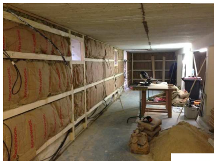
Future salle polyvalente