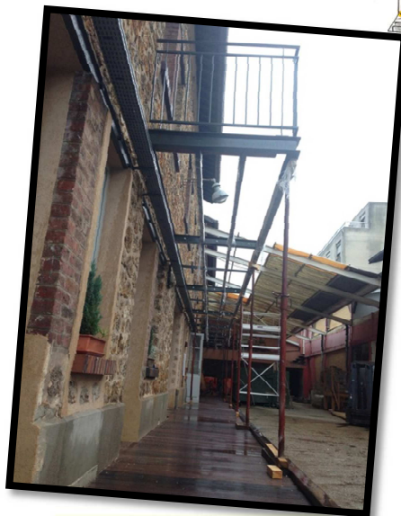
Et la passerelle...