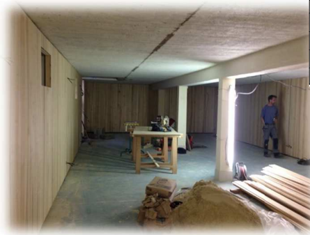
Futures classes du 1 er étage