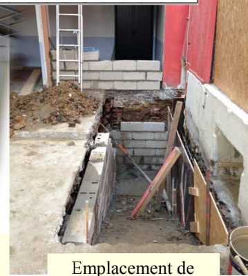
Emplacement de l'escalier