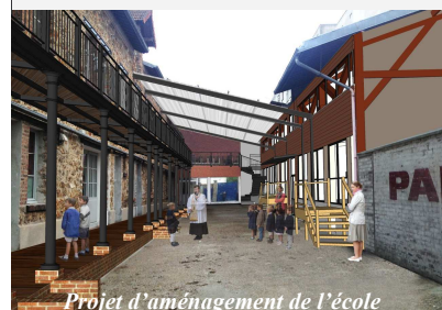
Projet d'aménagement de l'école