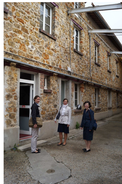
Quelques maîtresses visitent les futurs locaux...